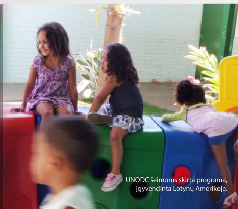
UNODC šeimoms skirta programa, įgyvendinta Lotynų Amerikoje.

- Mama, kuri su savo šeima dalyvavo UNODC šeimoms skirtoje programoje.